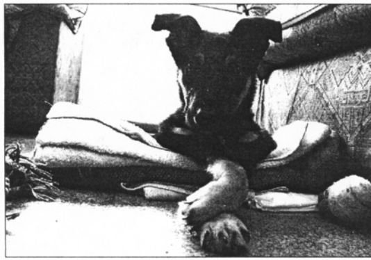
“Superpincho” recupera poco a poco la movilidad de sus cuatro patas.